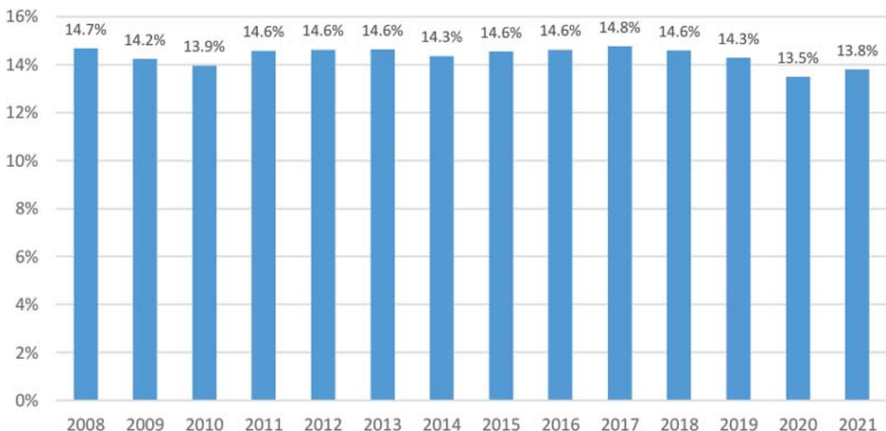
FIGURA 2. CONTRIBUCIÓN TOTAL AL PIB DEL SECTOR AUTÓNOMO PORCENTAJE DEL PIB. ESPAÑA. 2008-2021

Fuente: Consejo Económico y Social de la Comunitat Valenciana (CES-CV) (2023).